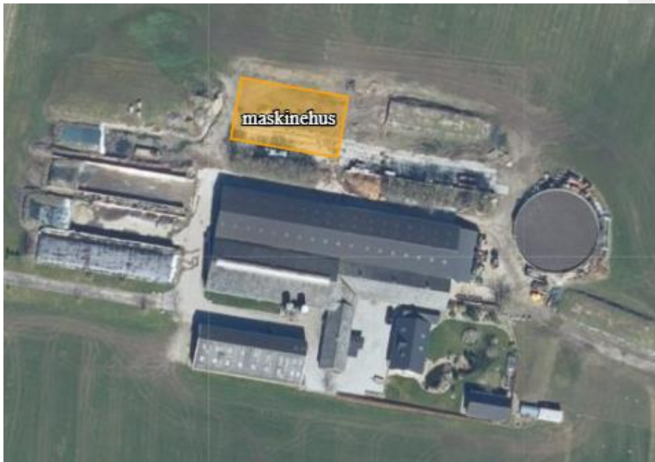
Figur 1 Placering af det ansøgte byggeri på luftfoto

Placeringen af det ansøgte byggeri fremgår af figur 1.